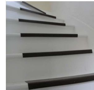
Después de los controles provisionales de pintura de plomo