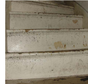
Antes de los controles provisionales de pintura de plomo